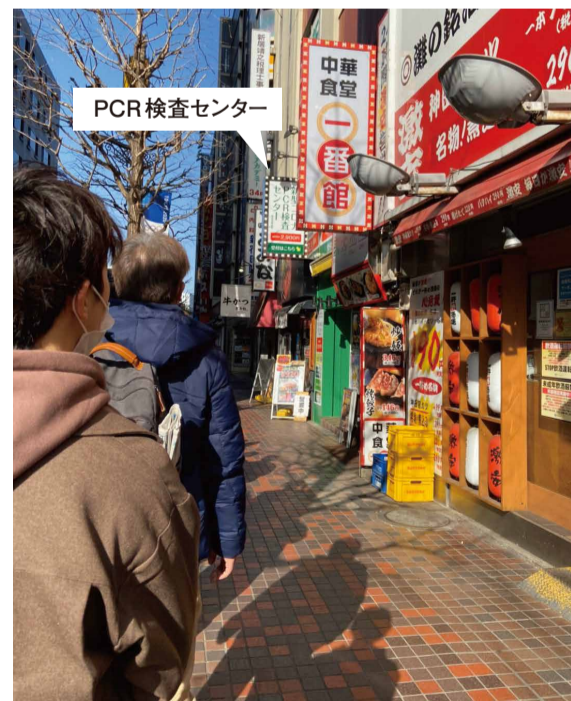
上記は木下グループが行っている歌舞伎町のPCR検査センターです。予約をすれば誰でも3,190円で検査を受けることができますが、予約をしても並んでいました。

障がい者施設利用者や職員がPCR検査をうけるため13,699,000円の補正予算が組まれました。負担割合は区が280,000円、東京都が13,419,000円を負担します。