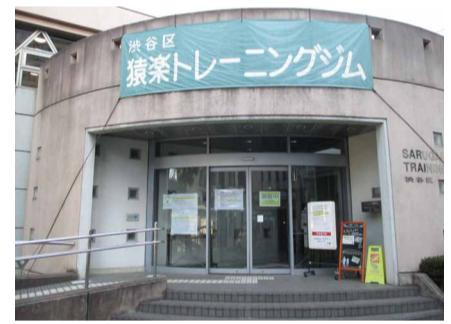
猿楽トレーニングジム