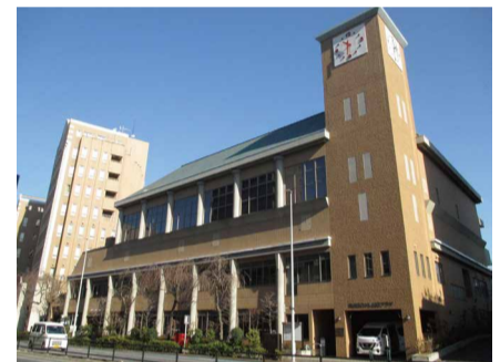
ひがし健康プラザ